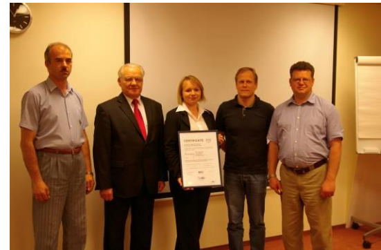
Sertifikato įteikimas UAB „Fermentas“