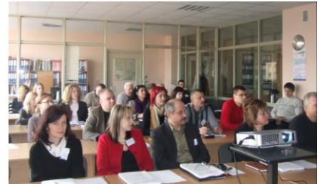
UAB „TUV Uolektis“ mokymų salė

Įkurtos įmonės tikslas buvo perteikti Lietuvos įmonėms Vokietijos praktinę patirtį, įdiegiant tarptautinius ISO 9000 serijos standartus. Ši patirtis buvo paskleista dėstant įmonių specialistų grupėms KTU profesinio tobulinimo centre ir konsultuojant Lietuvos įmones, kurios ryžosi diegti kokybės vadybos sistemas pagal ISO 9000 serijos standartus bei organizacijų atstovus supažindinant su ISO 9000 serijos standartais mokymų metu.