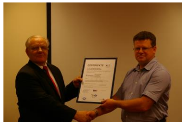
Pirmoji Lietuvoje sertifikuota bendrovė UAB „Fermentas“

UAB „TUV UOLEKTIS“ aktyviai reikšėsi Lietuvoje populiarinant kokybės vadybos sistemas. Įmonės specialistai buvo vieni iš iniciatorių steigiant Technikos Komitetą 24 „KOKYBĖ“ ir Lietuvos Kokybės draugiją. Jie aktyviai dalyvavo rengiant Lietuvos Nacionalinę Kokybės programą, kurios dėka Lietuvoje pradėti organizuoti Nacionalinio Kokybės prizo konkursai. UAB „TUV UOLEKTIS“ specialistų konsultuotos įmonės aktyviai dalyvavo šiuose konkursuose.