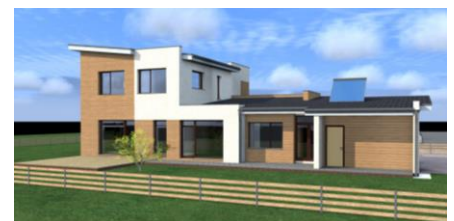
UAB „Veikmė“ pasyvusis namas