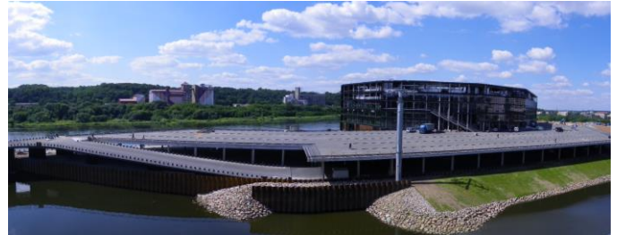
Kauno „Žalgirio arena“

Pasak UAB „Vėtrūna“ vadovų nuo 2003 m., kuomet buvo sertifikuotos vadybos sistemos, įmonės apyvarta išaugo 16 kartų. Įmonės vadovai kaip vieną iš tokios sėkmės faktorių įvardino vadybos sistemų įdiegimą ir sertifikavimą. Vadybos sistemos padėjo UAB „Vėtrūna“ įsitvirtinti Lietuvos rinkoje kaip vienai stambiausių statybos kompanijų, vykdančiai svarbiausius valstybinės reikšmės projektus, tokius kaip Kauno „Žalgirio arena“, didžiausios arenos Baltijos šalyse, statyba.