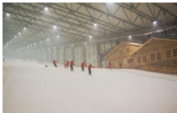
Žiemos pramogų kompleksas „Snoras Snow arena“

2000 metais UAB „Skirnuva“ buvo sertifikuota kokybės vadybos sistema, vėliau buvo sertifikuotos